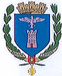
Ville de Breil sur Roya